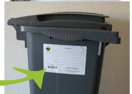
Bac pucé, la puce antenne est sous l'autocollant